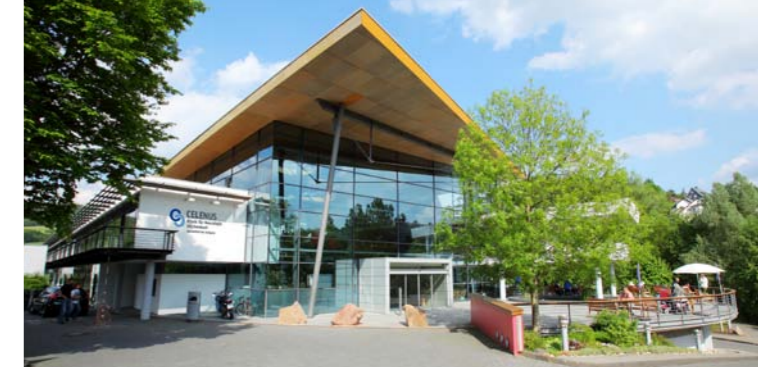
Die Celenus Klinik für Neurologie Hilchenbach