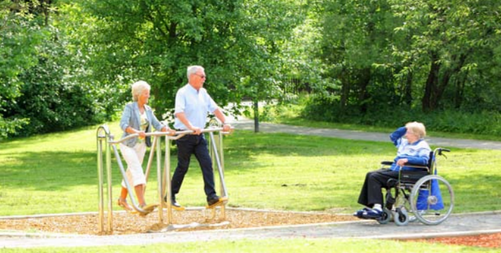
Rollstuhlgerechte Wege in Hilchenbach