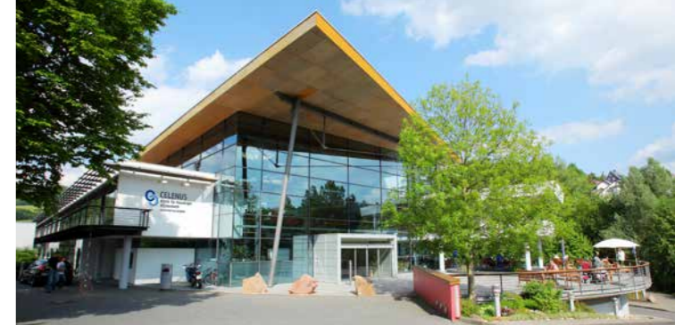
Die Celenus Klinik für Neurologie Hilchenbach